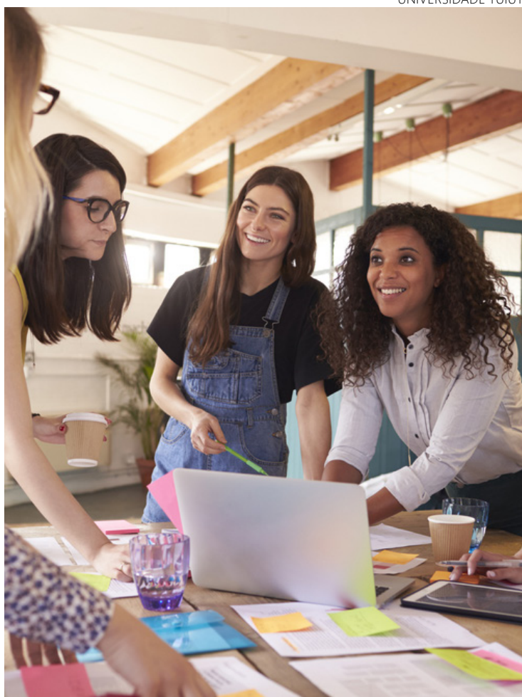
Levantamento atesta que o gênero feminino representa 50% da base total de colaboradores do setor financeiro