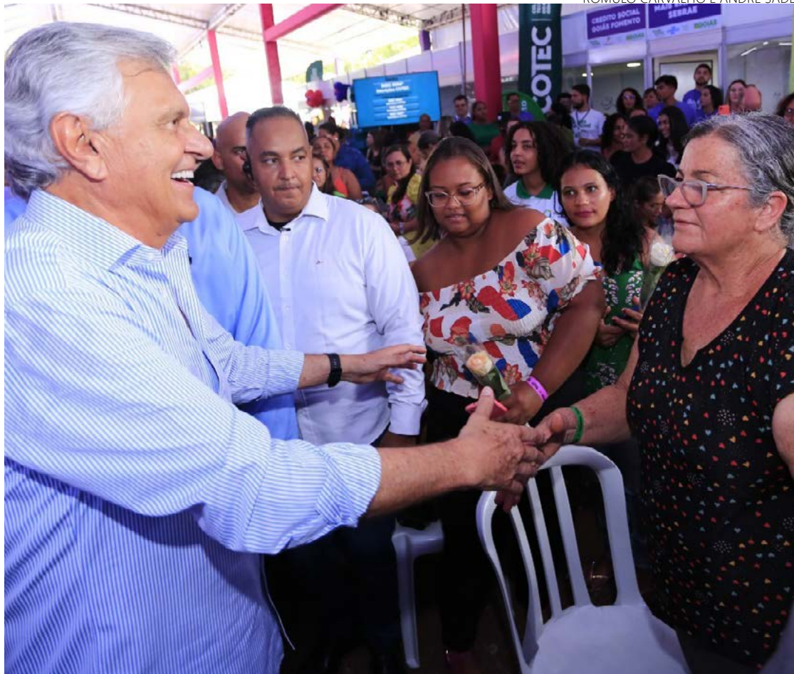
Governador Ronaldo Caiado participa de evento em homenagem ao Dia Internacional da Mulher

Políticas Sociais (GPS) reúne 15 órgãos e unidades do Estado, com oferta de 40 serviços estaduais gratuitos em um único local. Trata-se de um esforço do governo para facilitar o acesso das mulheres a benefícios sociais, emissão de documentos e entregas de cartões de programas voltados para elas, como o