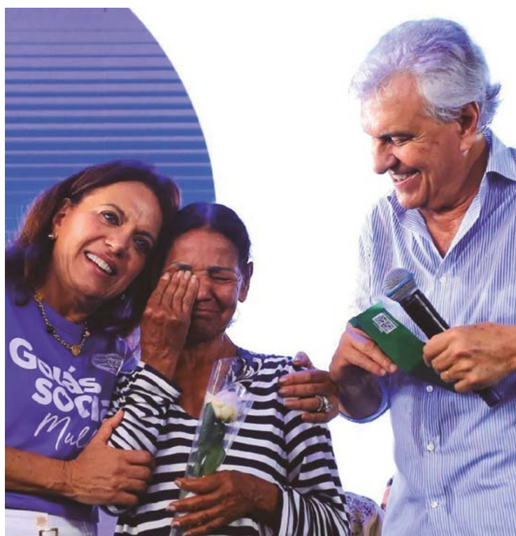
Primeira-dama Gracinha Caiado e governador Ronaldo Caiado, durante a primeira edição do programa, que já realizou 60 mil atendimentos

Parte dos serviços está disponível no Goiás Social Mulher, em Goiânia, que segue até este sábado, 9; ao todo são oferecidos 40 serviços gratuitos