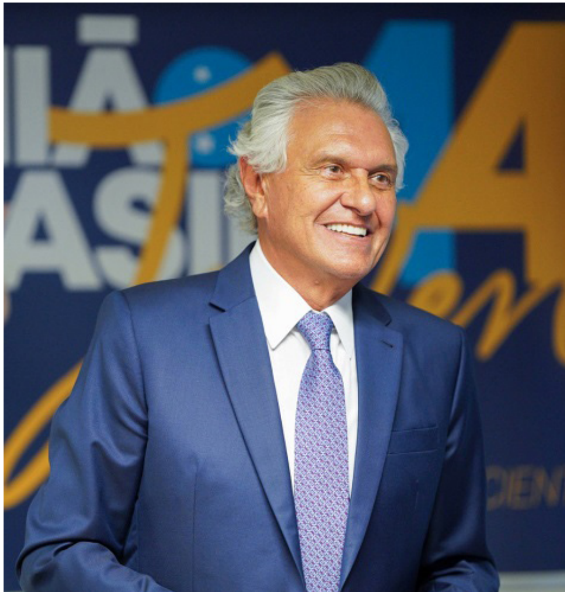
Ronaldo Caiado: frente de partidos fortalece a disputa presidencial no campo da direita

Um dos principais nomes para encabeçar a chapa majoritária do grupo é o do governador de Goiás, Ronaldo Caiado (UB), hoje o chefe de executivo estadual mais bem avaliado do Brasil, segundo pesquisa Atlas/Intel, divulgada recentemente. O goiano tem ganhado espaço na mídia nacional ao puxar o debate sobre a segurança pública no País, um dos principais gargalos da atual gestão do governo Lula.