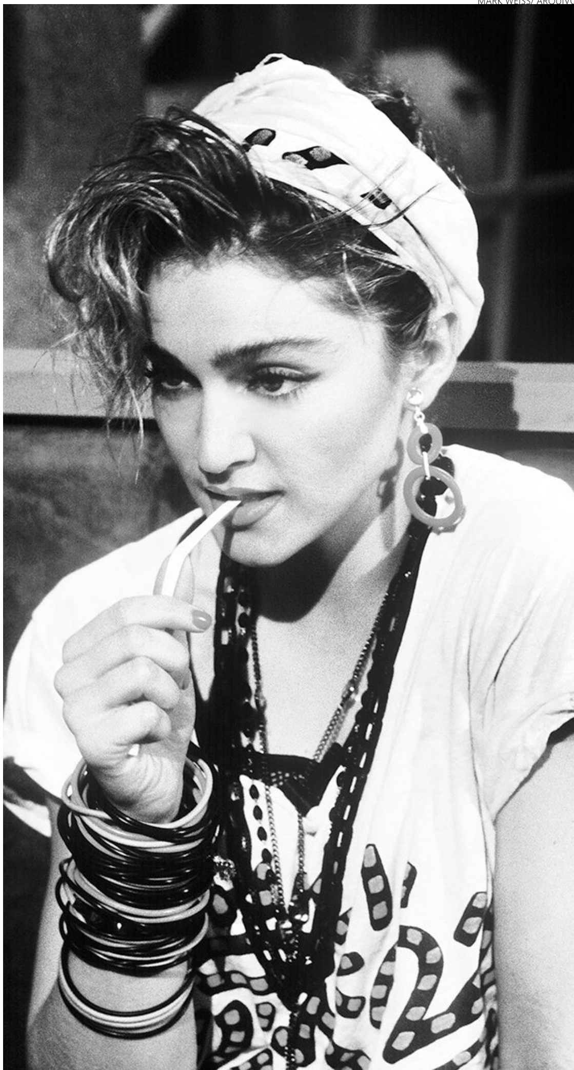
Madonna, rainha do pop, em 1984: show vai ocorrer na praia mais famosa do mundo

Madonna não provoca esse frisson à toa. Um dos maiores shows de sua carreira ocorreu nos palcos brasileiros, em 1993, ano em que conseguiu levar 120 mil fãs para o estádio Maracanã. Bem-humorada, sempre se referiu à apresentação como uma das mais importantes da extensa carreira, ao ponto de